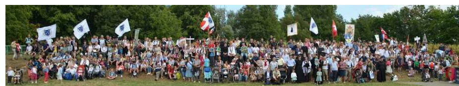
Pèlerinage de rentrée à Ars