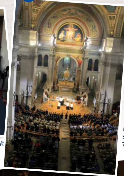
Messe en l'église Saint-François-Xavier avec le groupe scout de la 7 ème Paris