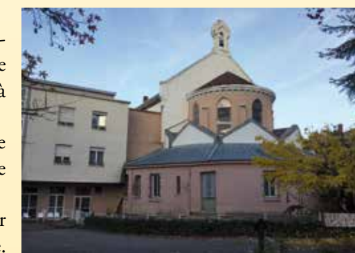
La rotonde de la chapelle à réhabiliter

Ces lourds chantiers devraient débuter dans les prochains mois et favoriser une dynamique missionnaire dans un quartier à forte population musulmane. Soyez vivement remerciés pour votre généreux soutien! ■