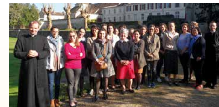
Retraite pour femmes à Avon-Fontainebleau

Le siège de l'Œuvre des retraites se trouve à la Bergerie, magnifique maison surplombant le lac d'Annecy, où se tiennent depuis l'an 2000 des retraites. Au cours des années qui suivirent, des retraites furent données un peu partout en France, mais ces deux dernières années, faute de disponibilité, nous avons dû recentrer nos retraites sur la Bergerie et