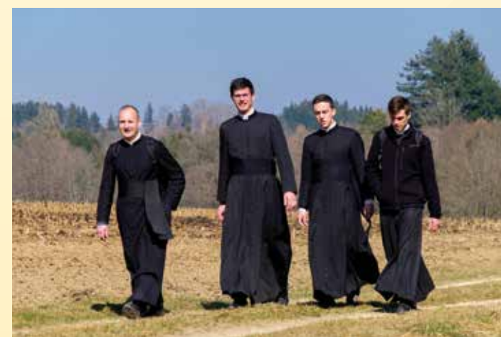
Promenade dans la campagne bavaroise

Ordinations diaconales de six francophones conférées par Mgr Haas: grande joie pour la Fraternité Saint-Pierre et l'Église!