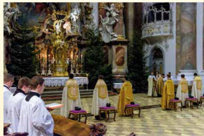
Messe chrismale à Vaduz