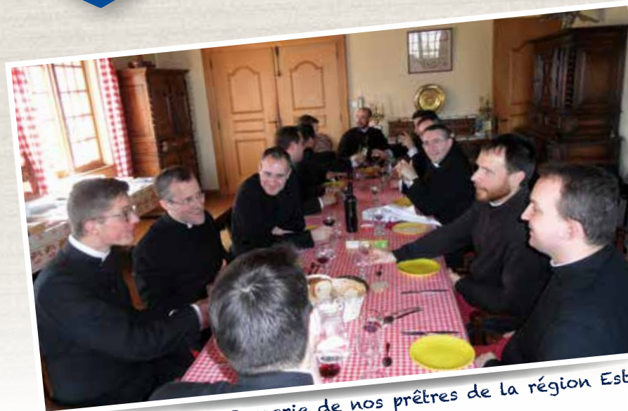
Retrouvailles à la Bergerie de nos prêtres de la région Est