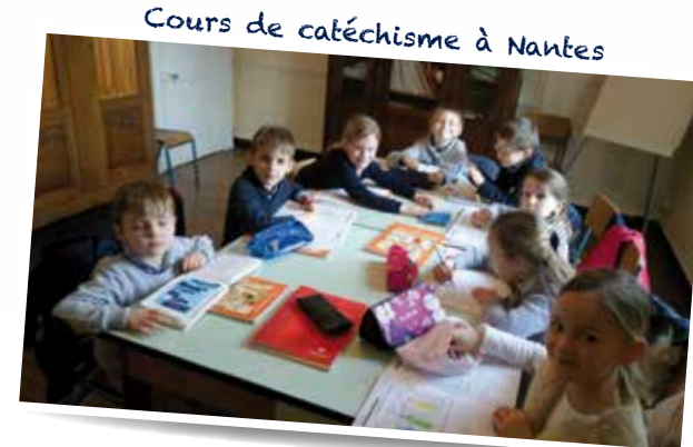
Cours de catéchisme à Nantes