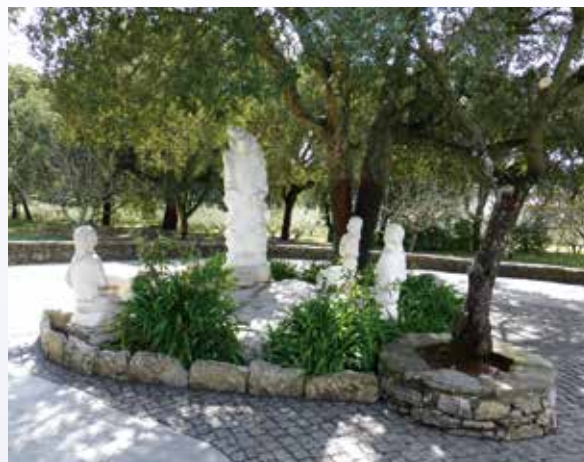
Le puits du jardin où apparut l'ange