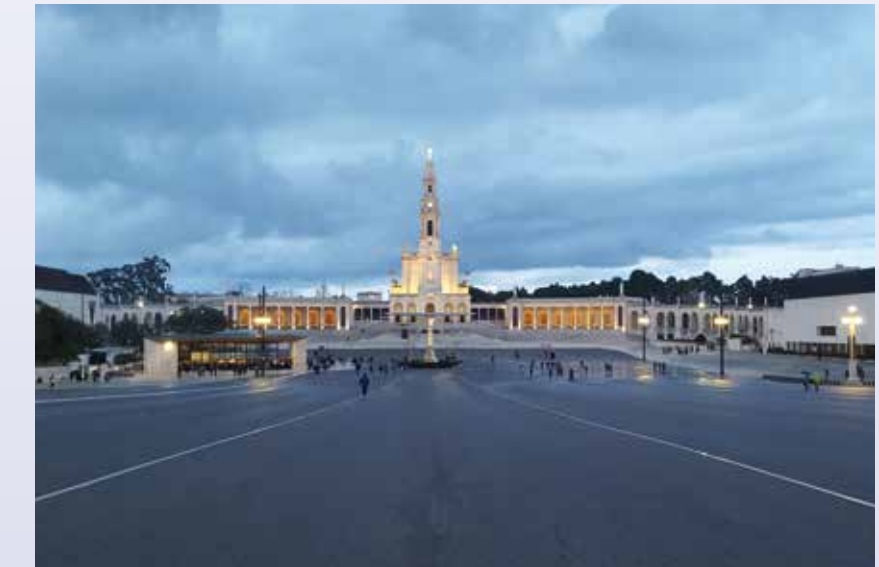
Le sanctuaire de Fatima

« Dernier appel pour les voyageurs à destination de Lisbonne... ». Bien que tout à fait authentique, cette annonce reste bien pauvre pour commencer un pèlerinage magnifique en l'honneur de Notre-Dame de Fatima, à l'occasion du centième anniversaire des apparitions. Pourtant, quarante-deux pèlerins de 11 à 77 ans ont choisi de consacrer quelques jours autour de la fête de l'Annonciation pour écouter et mettre en œuvre ce que Marie a voulu dire au monde par la bouche de Jacinthe, François et Lucie.