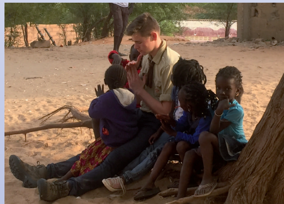
Petit cours de catéchisme