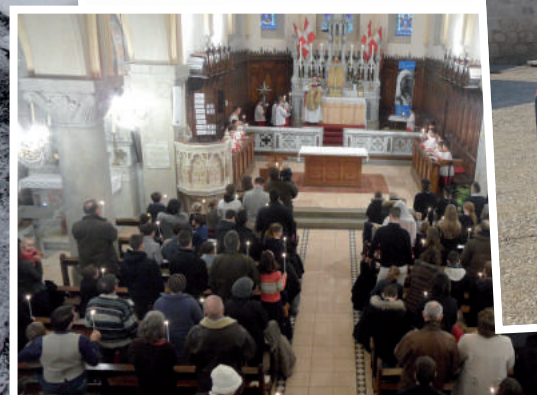
Messe dominicale dans notre apostolat de Duingt (74), au bord du lac d'Annecy