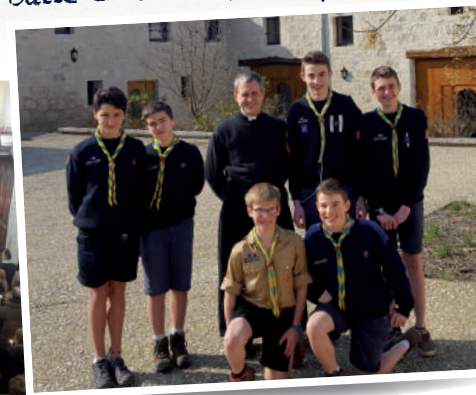
Sortie des scouts d'Europe de la 1ère Tarbes à l'abbaye bénédictine Sainte-Marie de la Garde (47)