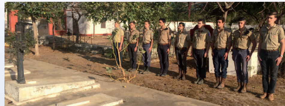
Devant les tombes des soldats oubliés de l'Empire