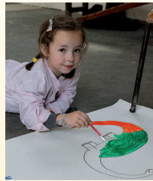
Le monstre du Loch Ness revisité

soutien en rencontrant les élèves. Avec l'ouverture d'une classe supplémentaire dès la deuxième année, l'école compte maintenant des classes de la grande section de maternelle au CM2.