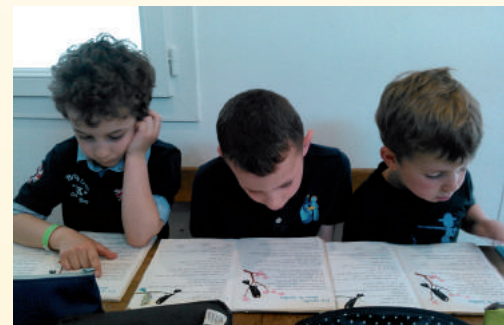
Apprentissage de la lecture

Le constat est au Mans le même qu'ailleurs, tant dans les méthodes d'apprentissage que dans le contenu des programmes: l'école d'État ne permet plus une formation complète et un enseignement classique. Forte de ce constat, une association de parents a ouvert l'école hors contrat Blanche de Castille en septembre 2013. La volonté de ces parents est de proposer une école qui se base sur trois fondamentaux: