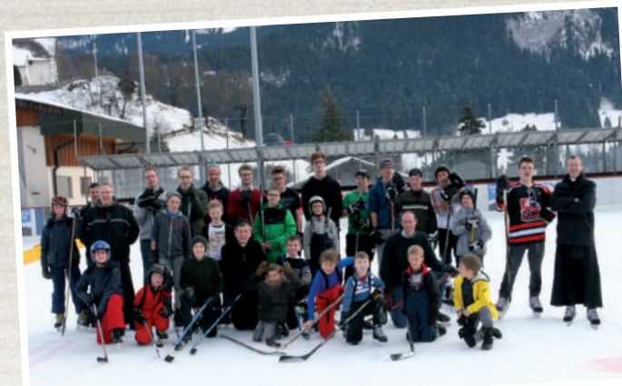
Match de hockey sur glace entre les servants d'autel de Fribourg et Bulle en Suisse francophone