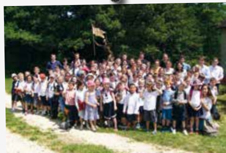
À la colonie Saint-Antoine, Messire Dieu premier servi !