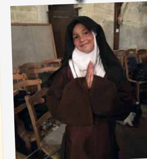
Une pièce de théâtre qui retrace la vie de sainte Thérèse d'Avila