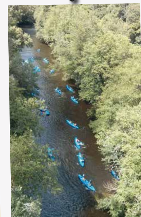
Excursion en canoë