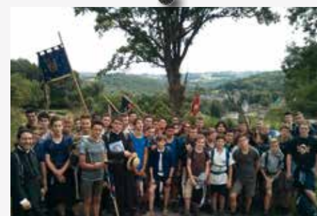
Le Raid Saint-Michel devant le château de Chastelux-sur-Cure