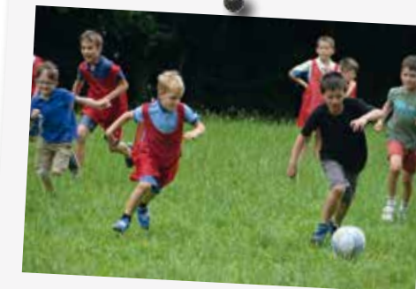
Rien ne vaut une bonne partie de foot