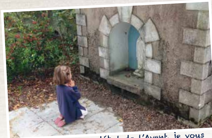
Vierge Marie, en ce début de l'Avent, je vous confie l'école de la Providence de Baure (40) que j'aime tant