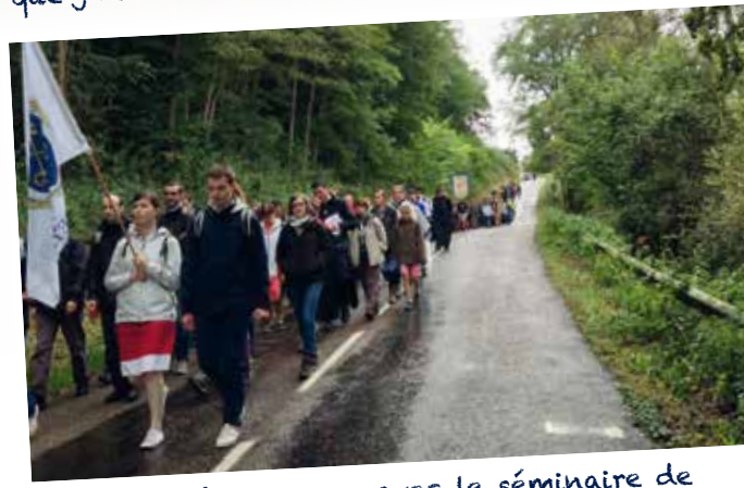
Pèlerinage à Faverney avec le séminaire de Wigratzbad