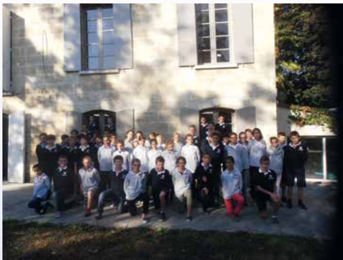
L'ensemble des collégiens de la rentrée scolaire 2016

Un couple de parents dont l'enfant était mis à l'écart dans son ancien établissement nous confiait récemment : « Notre fils a retrouvé la joie de vivre et le goût d'apprendre. Un jour qu'il avait une difficulté, ses camarades sont venus le trouver et lui ont dit : - ne t'inquiète pas, nous allons t'aider. On ne peut pas avoir tous les talents, mais avec du courage tu y arriveras de mieux en mieux. ». Ce bel exemple de charité fraternelle, recueilli parmi d'autres, est un véritable encouragement à poursuivre la croissance du collège.