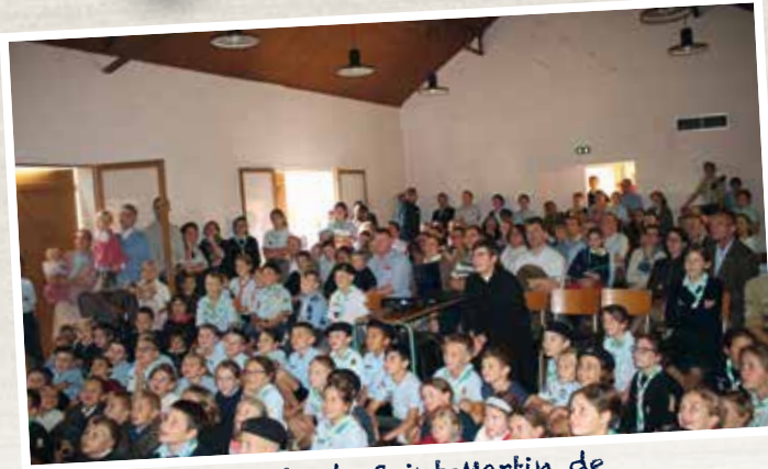
Les Europa scouts de Saint-Martin de Bréthencourt (78) font leur rentrée!