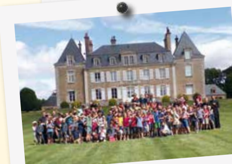
Photo de famille au camp Notre-Dame de Grâce