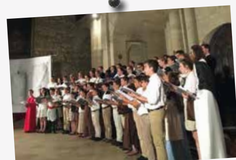
Le concert final, but et récompense de la colonie Fra Angelico