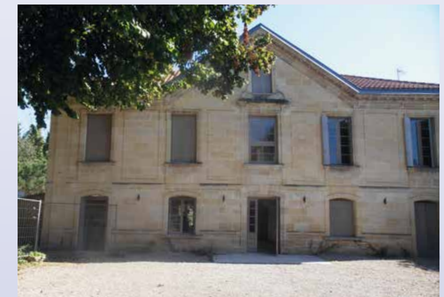
Le bâtiment principal du Collège Saint-Fort après remise en état