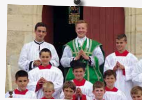
Les enfants sont heureux de servir la messe de leur aumônier