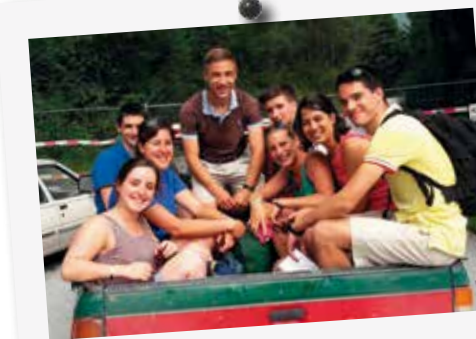
À la Route Saint-Pierre, presque tout se fait à pied !