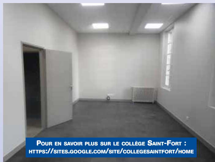
Une des classes après travaux

Régulièrement, des parents nous expriment l'épanouissement, la joie et la motivation de leurs enfants. Ces témoignages révèlent le bien qui s'accomplit à Saint-Fort.