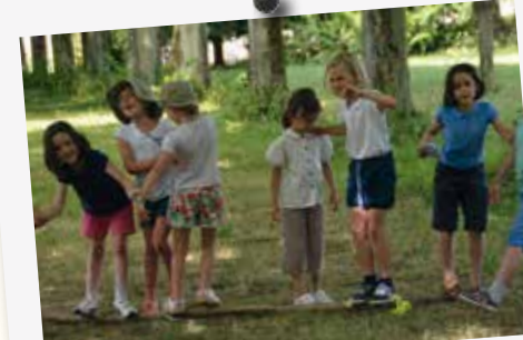
À la colonie Saint-Jean-Baptiste de la Salle, il fait bon rire en jouant...