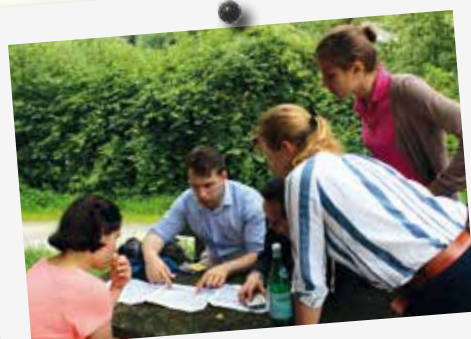
Les chefs d'équipes préparent leur itinéraire pour le lendemain