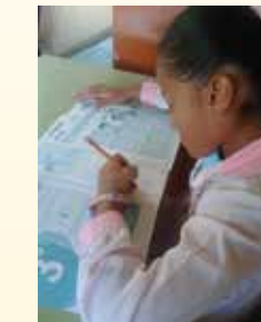
Une élève studieuse et heureuse d'apprendre

Depuis presque huit ans, la Fraternité Saint-Pierre est présente en Colombie, à Anolaima. Dès le début, la nécessité d'un projet éducatif solide s'est fait sentir. C'est ainsi qu'une école avait été créée avec comme idée maîtresse, la formation et l'éducation, selon la devise des Salésiens, d'une nouvelle génération de « bons chrétiens ». Après le primaire, il avait fallu songer à ouvrir un cycle secondaire et construire de nouveaux bâtiments.