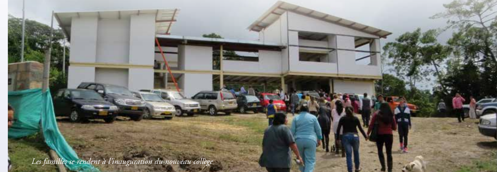
Les familles se rendent à l'inauguration du nouveau collège

Depuis presque huit ans, la Fraternité Saint-Pierre est présente en Colombie, à Anolaima. Dès le début, la nécessité d'un projet éducatif solide s'est fait sentir. C'est ainsi qu'une école avait été créée avec comme idée maîtresse, la formation et l'éducation, selon la devise des Salésiens, d'une nouvelle génération de « bons chrétiens ». Après le primaire, il avait fallu songer à ouvrir un cycle secondaire et construire de nouveaux bâtiments.