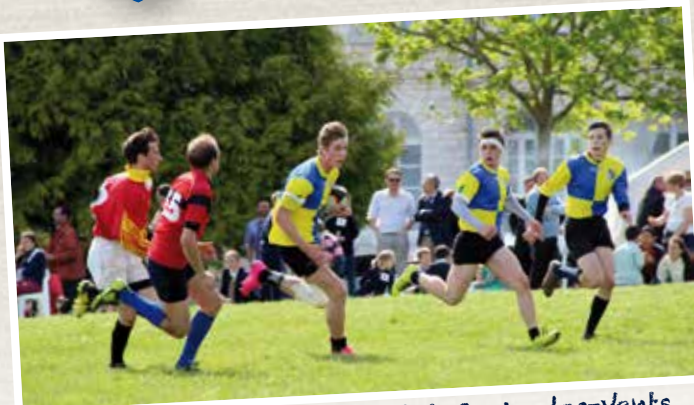
Quand les élèves de l'institut Croix-des-Vents jouent au rugby, le niveau et le spectacle sont au rendez-vous !