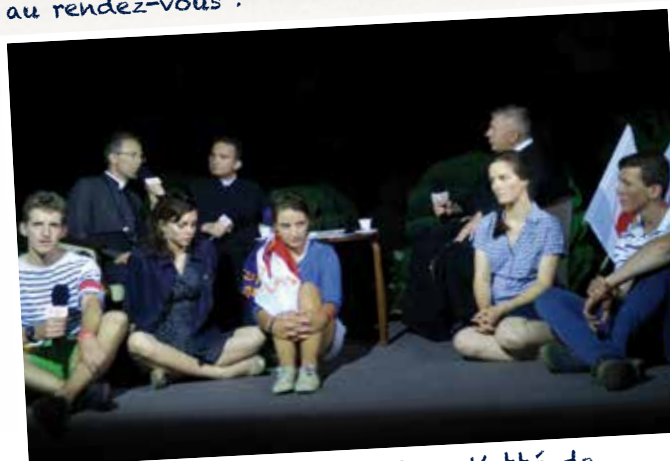
Lors des JMJ avec Juventutem, l'abbé de Malleray est interviewé par Trawn, la télévision polonaise catholique