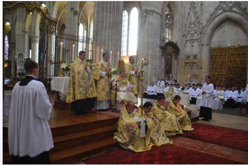
Sermon du Cardinal Ricard