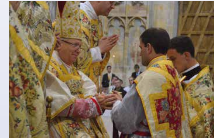
Dernier avis de l'évêque au nouveau prêtre