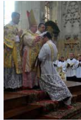
Imposition des mains

d'une foule nombreuse. Puis se déroule pour nous le rite de l'ordination que nous avons vu de nombreuses fois les années précédentes pour nos confrères ordonnés prêtres. La prostration, l'imposition des mains de l'évêque, la consécration des mains, l'imposition de la chasuble sont autant de moments qui marquent la cérémonie de l'ordination. La messe s'achève au bout de trois heures d'une magnifique liturgie. C'est naturellement émus que nous processionnons vers la sortie. Sur le parvis de la cathédrale, nos premières bénédictions sont pour nos familles