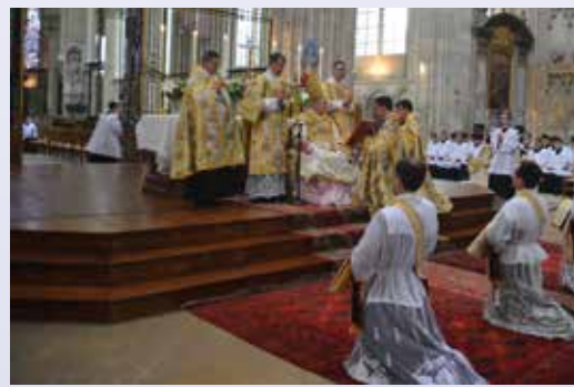
Monition aux ordinands

Nous nous retrouvons le lendemain, 18 juin, jour de l'ordination. C'est assez fébriles que nous nous habillons dans la sacristie. La procession se met en marche et nous nous approchons du chœur de la cathédrale, au milieu