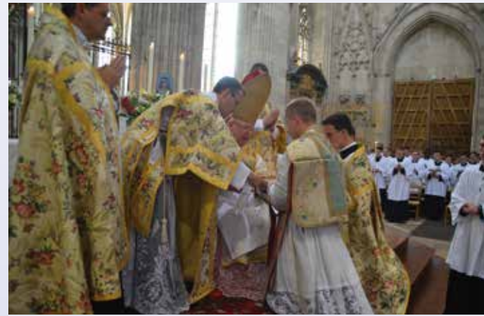
Onction des mains des nouveaux prêtres

d'une foule nombreuse. Puis se déroule pour nous le rite de l'ordination que nous avons vu de nombreuses fois les années précédentes pour nos confrères ordonnés prêtres. La prostration, l'imposition des mains de l'évêque, la consécration des mains, l'imposition de la chasuble sont autant de moments qui marquent la cérémonie de l'ordination. La messe s'achève au bout de trois heures d'une magnifique liturgie. C'est naturellement émus que nous processionnons vers la sortie. Sur le parvis de la cathédrale, nos premières bénédictions sont pour nos familles