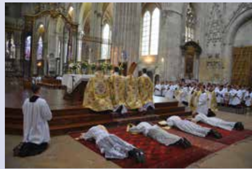
Prostration pendant la litanie des saints