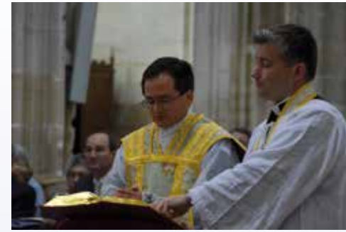
Les jeunes prêtres sont aidés par un prêtre assistant pour célébrer la messe

et amis présents à nos côtés. Mais déjà nous pensons à la première messe privée que nous célébrerons le lendemain, la première de toutes celles de notre vie. La cérémonie d'ordination tant attendue tout au long de notre séminaire est déjà terminée; fin de la vie de séminariste, début d'une vie de prêtre. ■