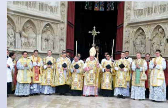
Sortie de messe : 4 nouveaux prêtres pour l'Église!