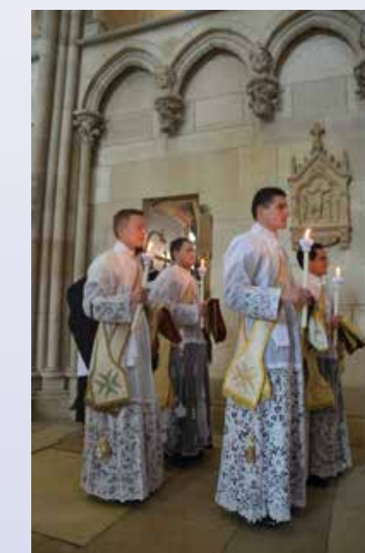
Les futurs prêtres au début de la messe

Octobre 2009. Nous sommes une dizaine de séminaristes francophones à nous retrouver à Annecy pour notre récollection de rentrée au séminaire. Les sept années de formation à venir nous paraissent longues. Mais, avec le recul, elles passeront en réalité très vite. Les cours de spiritualité, de philosophie et de théologie se succèdent. La formation spirituelle et humaine reçue permet de discerner au mieux l'appel ressenti à la vocation sacerdotale. Les années au séminaire sont rythmées par la réception des différents ordres mineurs (por-