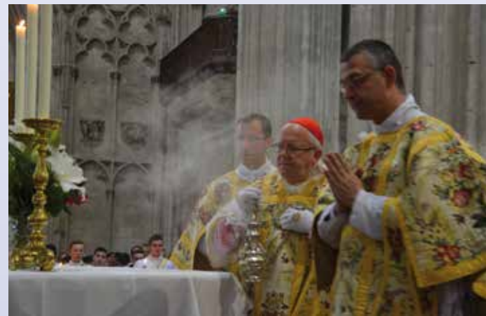
Encensement de l'autel