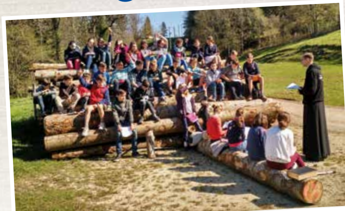
Les enfants écoutent attentivement l'abbé pendant la récollection des professions de foi à Besançon