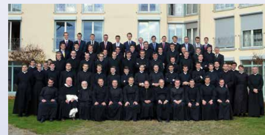
Au premier rang, le corps professoral du séminaire

« La formation des prêtres est l'activité la plus importante de la Fraternité Sacerdotale Saint-Pierre » (Directoire pour la formation)