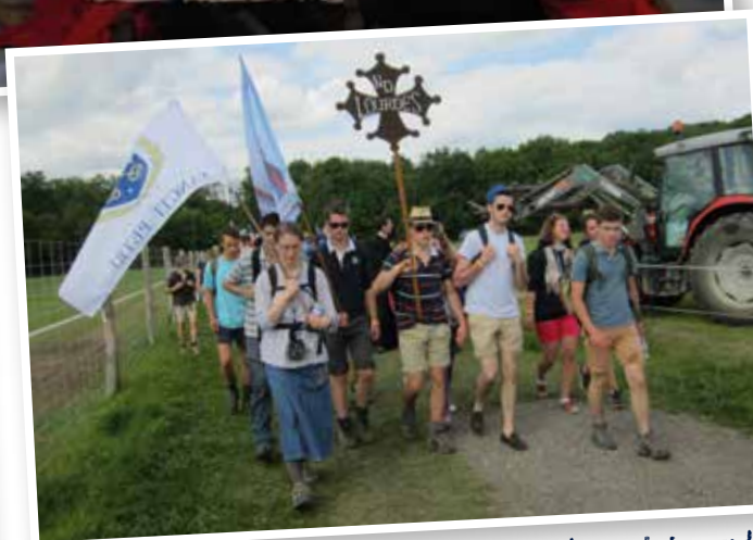
Le chapitre des communautés de Tarbes et Lourdes au pèlerinage de Notre-Dame de Chrétienté