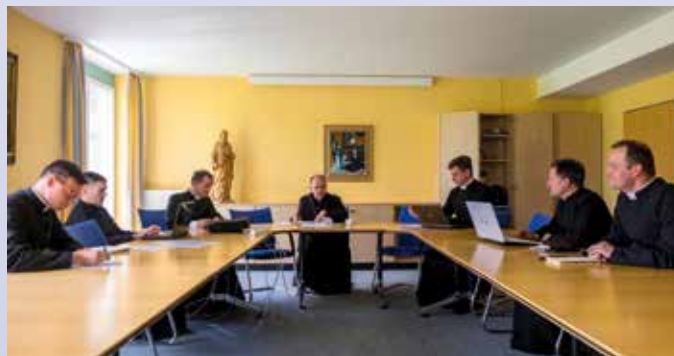
Le conseil des professeurs

Bien conscients des enjeux, les formateurs se recommandent à votre prière si précieuse, pour que l'Esprit-Saint les aide à communiquer aux futurs prêtres l'amour de la vérité et la ferveur dans la charité, c'est-à-dire la sainteté. ■