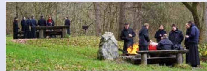
Pique-nique dans les bois à l'occasion d'une sortie de communauté

Le séminaire se déplace à Türkheim, où la messe en l'honneur de saint Joseph est célébrée dans l'église paroissiale. La communauté se promène ensuite deux heures en forêt, dans les environs de Bad Wörishofen.