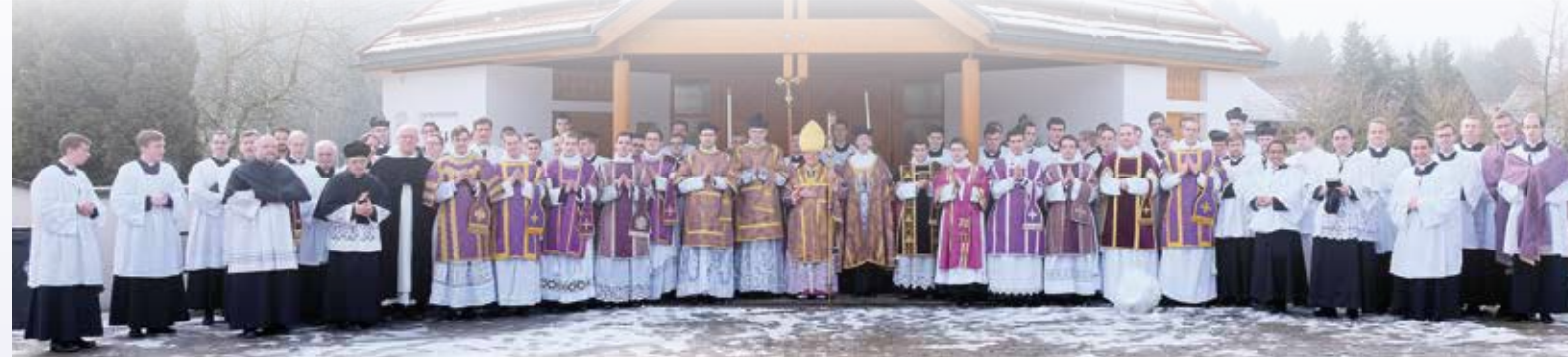
Photo de famille après les ordinations sous-diaconales et les ordres mineurs