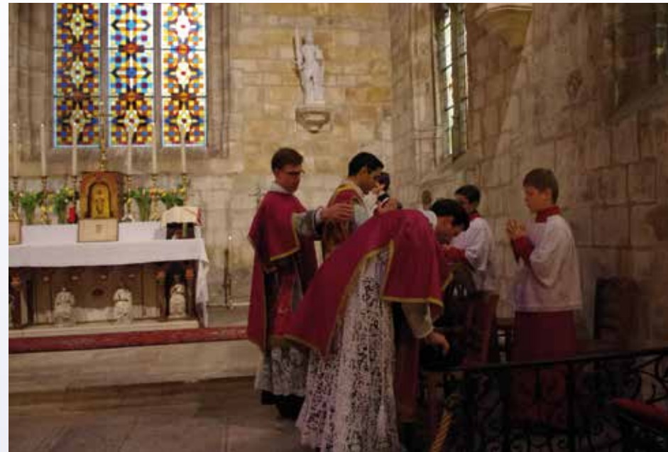
Messe solennelle en l'église Saint-Michel d'Ingouville

Au sommet de la falaise de craie que Maupassant se plaisait à décrire comme la plus belle du monde, on aperçoit la petite chapelle de Notre-Dame-des-Flots, lieu admirable de dévotion. Elle guide les navires dans leur arrivée au port et les marins y viennent prier. Elle est comme