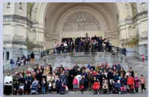
Récollecion de Carême à Lisieux

La présence désormais permanente de deux prêtres permet de mettre en place un certain nombre de projets. Il s'agit entre autres de trouver une église qui pourra accueillir la communauté des fidèles de façon plus pérenne. Si la chapelle de la Sainte-Famille utilisée actuellement a l'avantage de se trouver en plein centre-ville, sa capacité d'accueil un peu trop juste rend nécessaire la célébration dans un nouveau lieu de culte. Grâce à un accueil fraternel du curé de la paroisse Sainte-Trinité,