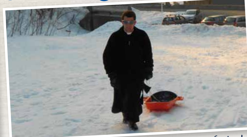
...tandis que d'autres tirent la luge pour les enfants du catéchisme. Le tout pour la plus grande gloire de Dieu!