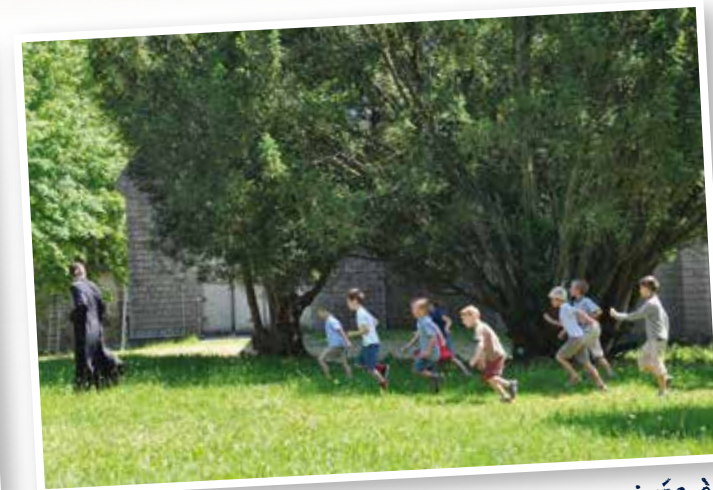
Encore un effort, nous sommes presque arrivés à la porte du Ciel!