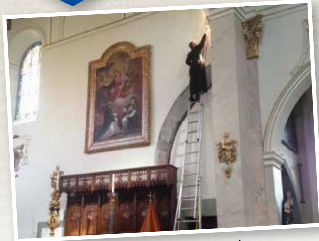
Certains prêtres affrontent le vide pour changer les spots de leur église...