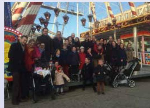
Une sortie communautaire qui a ravi les enfants... et leurs parents !

Depuis plusieurs années, la Fraternité Saint-Pierre est présente au Havre. La messe est célébrée dans l'église Saint-Michel d'Ingouville qui, en plus d'avoir été préservée des bombardements de 1944, est la plus ancienne église de la ville.