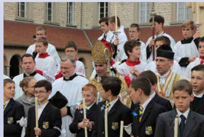
Les jeunes confirmés entourent Mgr Habert

À l'ombre de l'institut Croix-des-Vents, à Sées, se développent deux apostolats de type paroissial : le premier dans la chapelle de l'école et le second à Saint-Langis-Mortagne. En effet, un certain nombre de familles se sont regroupées autour de l'établissement pour bénéficier des bienfaits de l'enseignement qui y est donné et une petite école primaire mixte a été fondée en septembre 2013 pour instruire les petits frères et sœurs des garçons du collège et lycée. Ces familles assistent donc aux messes dominicales, profitent de cours de ca-