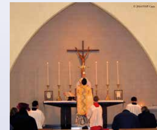
Messe dominicale dans la chapelle de la Sainte-Famille