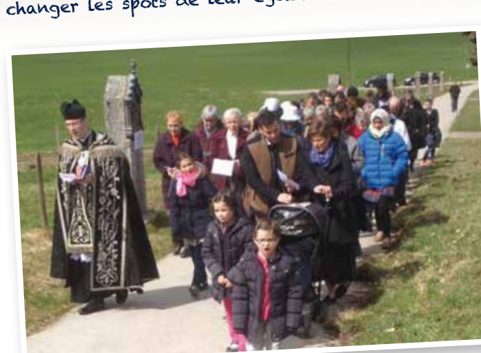
Chemin de croix avec les communautés suisses de Fribourg et Bulle