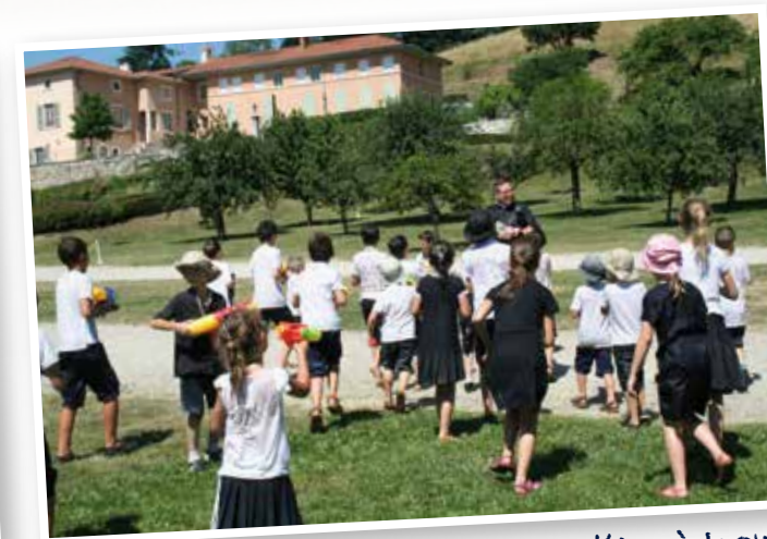
Les élèves de l'école Sainte-Jeanne d'Arc à Lyon en pleine chasse... à l'aumônier !