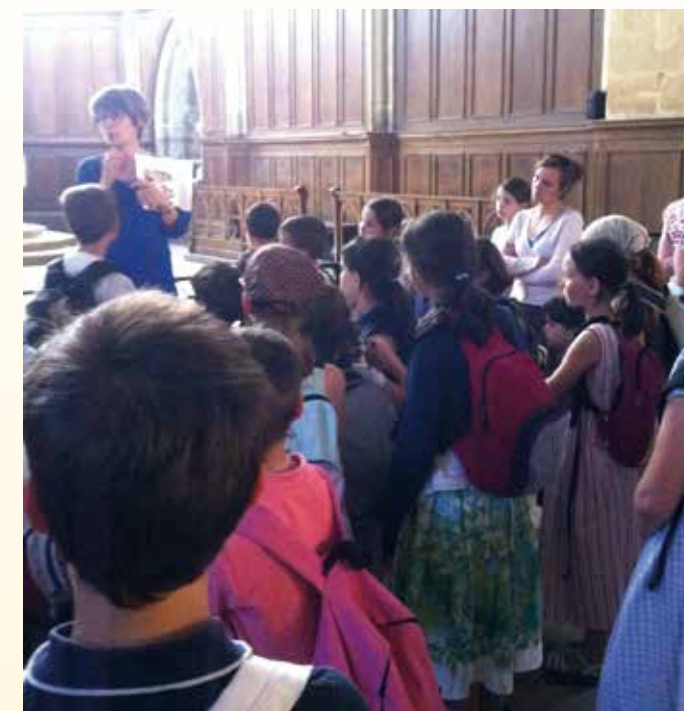
Le guide explique aux élèves le miracle de Faverney