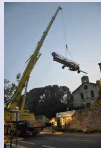
La chapelle au début des travaux

Depuis plus d'un an, l'ensemble de la toiture a été refait et le drainage périphérique de l'édifice réalisé: deux actions prioritaires, car il pleuvait dans la chapelle et de très importantes remontées capillaires d'humidité altéraient les murs. La cloche, de 1804, a été déposée et reconditionnée. Elle appelle à nouveau pour la messe dominicale après plus de 50 ans de silence! Commencée au mois de septembre, la réfection de l'ensemble des façades s'est achevée avant Noël. Puisque la chapelle est désormais sauvegardée et mise hors d'eau, il est envisagé la réfection des décors intérieurs. Voilà de belles perspectives pour l'avenir!