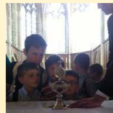
Les élèves regardent attentivement les reliques du miracle

Après un voyage en bus d'une heure, tous les élèves, les maîtresses et l'aumônier sont arrivés dans le petit village de Faverney. En plus d'incarner le village franc-comtois typique, Faverney a été favorisé d'un miracle eucharistique très important au début du XVII e siècle. Les moines alors présents avaient laissé pendant une nuit le Très Saint-Sacrement, exposé sur un reposoir, avec de nombreux cierges, fleurs, et tentures. Le lendemain matin, à l'ouverture de l'église, ils trouvèrent le reposoir en cendres, ou presque, et furent stupéfaits de constater que l'ostensoir tenait tout seul dans le vide, ne reposant sur rien. Au bout de 33 heures de lévitation - ce qui permit à des milliers de témoins de confirmer le prodige - l'ostensoir descendit sur un corporal disposé en-dessous, alors qu'un prêtre célébrait la sainte Messe sur l'un des autels latéraux de