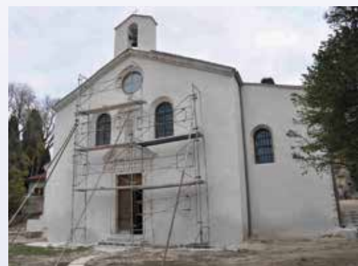
Réfection des façades de la chapelle

Abbé Thibault Paris Chapelain de Notre-Dame de la Rose