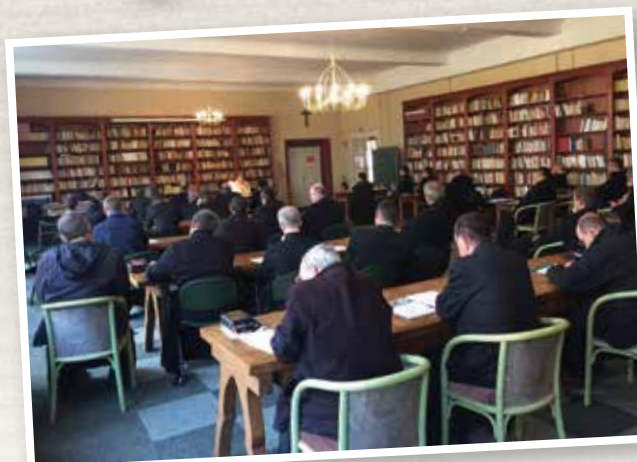
Les prêtres du district de France en session de formation à Sées avec le Père Louis-Marie de Blignièrès