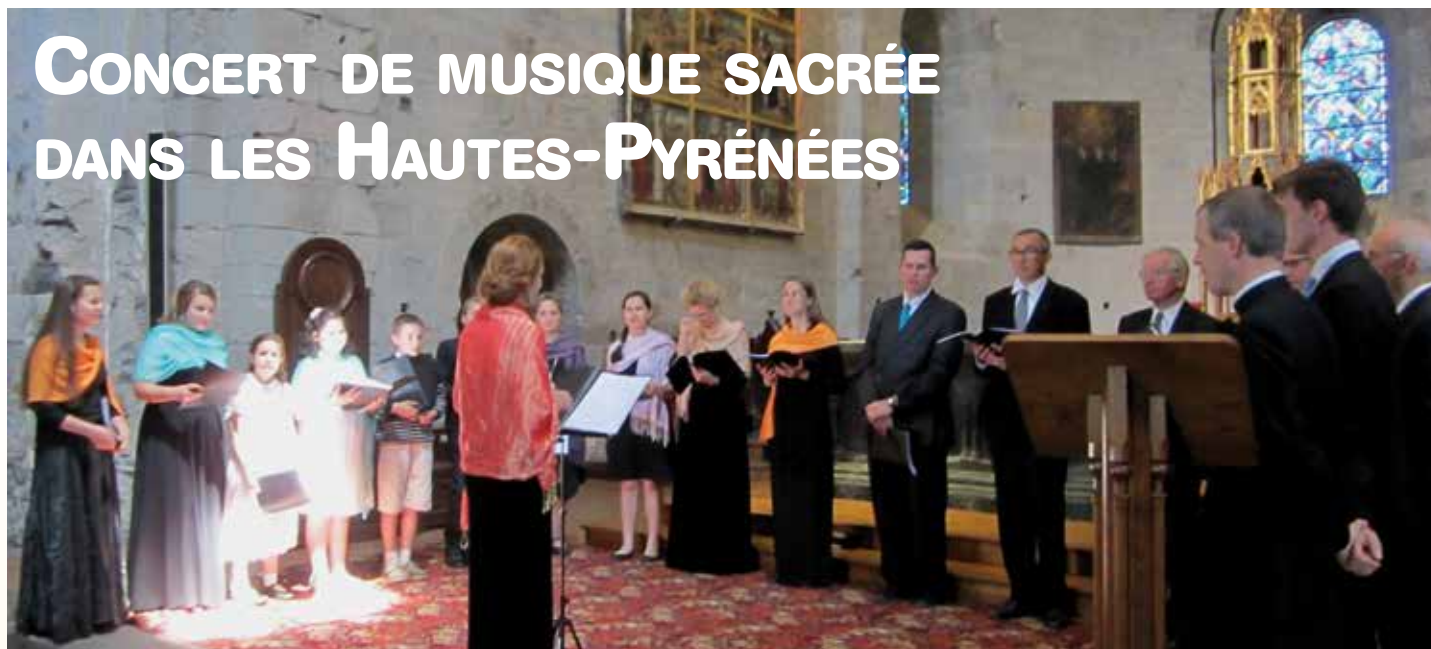
La chorale Saint-Sever chante dans la belle église de Saint-Savin