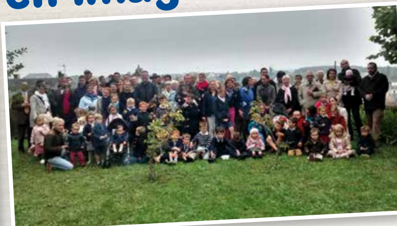
Rien de tel qu'une belle photo pour immortaliser une communauté jeune et rayonnante à Chartres !