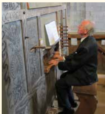
L'orgue de Saint-Savin fait vibrer les voûtes de l'église