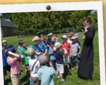
Rassemblement des troupes