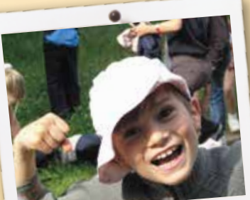
Heureux d'être en grand jeu