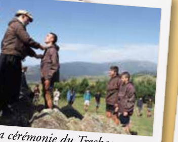
La cérémonie du Treckage