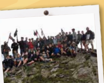
Photo de groupe du Raid 2013