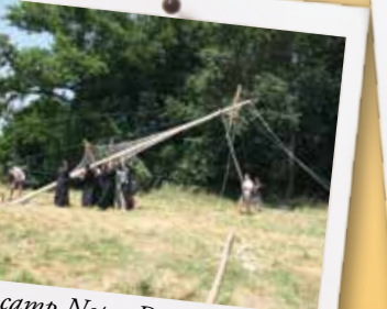
Le camp Notre-Dame de grâce leve son mât