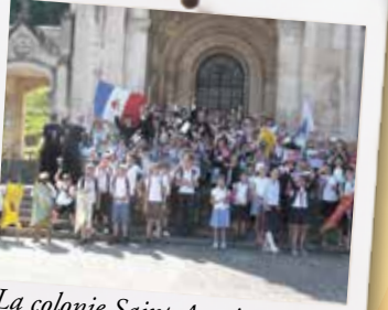
La colonie Saint-Antoine devant la basilique de Domrémy