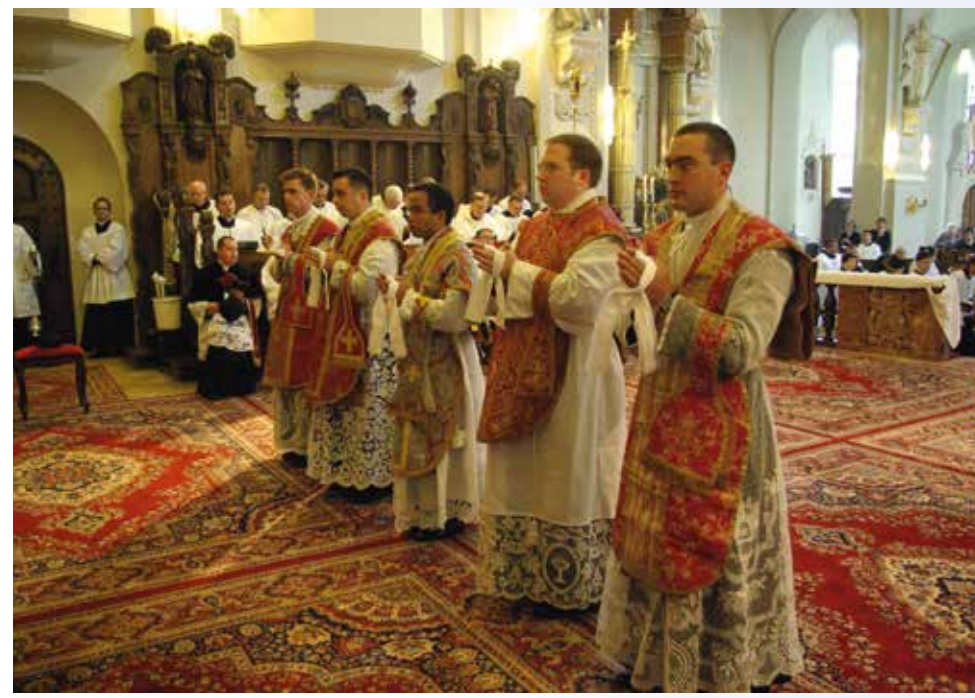
Prêtres pour l'éternité

un sens nouveau, et oh combien sublime ! Si les gestes de la Messe ont été étudiés et semblent acquis, ils prennent eux aussi une signification toute particulière. Et la crainte de vivre cette première Messe comme une simple répétition s'efface rapidement devant la grandeur du mystère qui se réalise. Réunissant les intentions de l'Église universelle, celles de mes proches, puis celles de mon propre ministère, c'est alors que, pour la première fois, j'élève vers le ciel le Corps et le Sang précieux de Notre-Seigneur, après avoir répété les paroles qu'Il