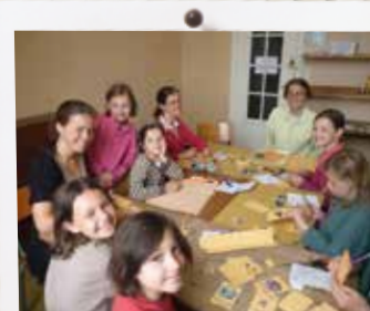
Activités manuelles à la colonie Saint Jean-Baptiste de la Salle