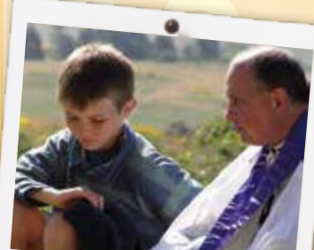
Entretien spirituel avec l'aumônier