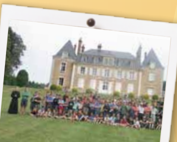
Photo de famille du camp Notre-Dame de Grâce