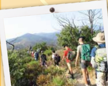
Le Raid à travers les montagnes catalanes