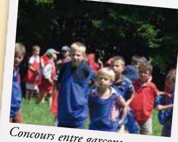
Concours entre garçons