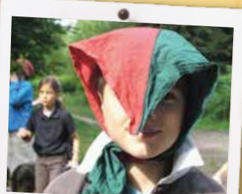
Un colon fier de porter le foulard d'honneur