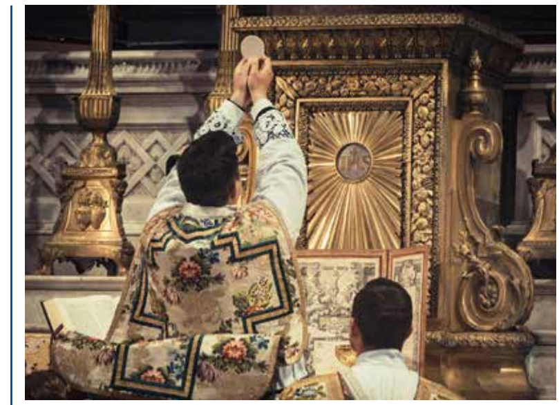
Hoc est enim Corpus Meum

Dans le précédent numéro de la Lettre aux Amis et Bienfaiteurs, l'article principal relatait l'émouvante cérémonie du 29 juin dernier, au cours de laquelle, avec quatre de mes confrères, je fus ordonné prêtre. Dans une certaine continuité, ce présent article a pour but de tenter d'exprimer quelle fut la joie d'être ainsi consacré à Dieu, mais aussi de vous décrire mes premiers pas dans le ministère sacerdotal. Intraduisible... Telle est souvent la première réponse qui me vient à l'esprit lorsque l'on me demande mes impressions sur ma nouvelle vie de prêtre. Intraduisible, pourquoi ? Parce que la grâce reçue le jour de l'ordination, étant elle-même d'ordre surnaturel, dépasse l'entendement humain. Intraduisible, parce que plus le mystère est grand, plus la contemplation prend le dessus sur notre besoin de comprendre. « Le prêtre ne se comprendra bien que dans le ciel » disait le saint Curé d'Ars.