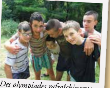
Des olympiades rafraîchissantes