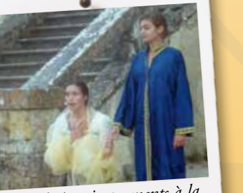
Veillée théâtre-instruments à la colonie Fra Angelico