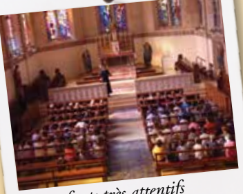
Des enfants très attentifs pendant le cours de catéchisme