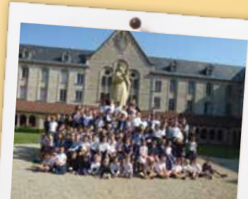
Notre-Dame est bien entourée