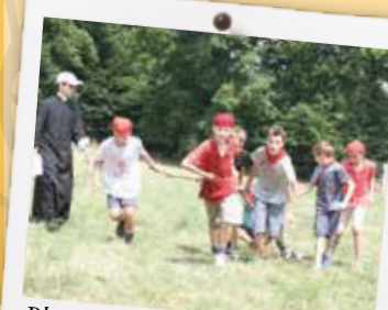
Plus vite les rouges