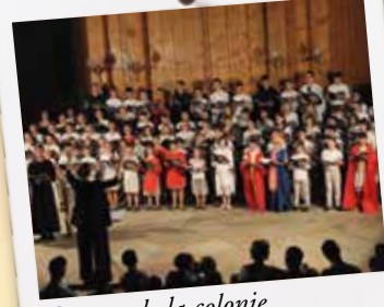
Concert de la colonie Fra Angelico à Bazas