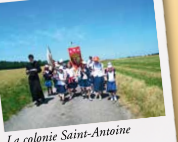
La colonie Saint-Antoine en pèlerinage