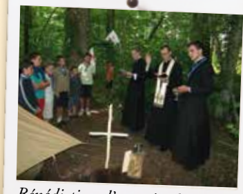
Bénédictio d'un coin d'équipe