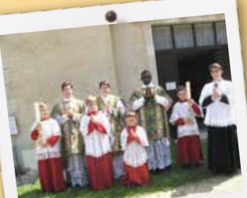
Pour la plus grande gloire de Dieu