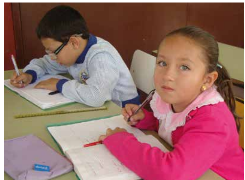
Des enfants studieux

« Il était une chose que tous savaient impossible, un vieux fou essaya et y parvint ».