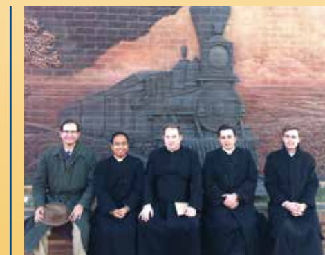
Visite de Lincoln

Le séminaire américain de la FSSP est situé près de Lincoln, centre géographique des États-Unis. Un accueil fraternel nous fut réservé dans cette maison religieuse, spectaculaire et bien organisée. L'église, nouvellement édifiée, offre un cadre parfait pour la prière et la récitation de l'Office Divin.