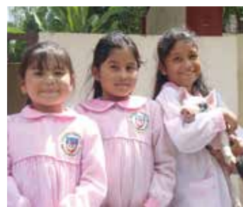
Les enfants à la ferme de l'école

Abbé Jean-Laurent Lefèvre Économe du district de France