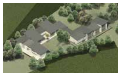
Projet de construction de l'école Saint Dominique Savio

Nous avons pu mesurer les peines, les difficultés de nos abbés et nous avons vu leur humilité nous cacher bon nombre de leurs tracas. « Il était une chose que tous savaient impossible... » sauf peut-être à ceux qui sont habités par le Feu Sacré, le Feu de Dieu !