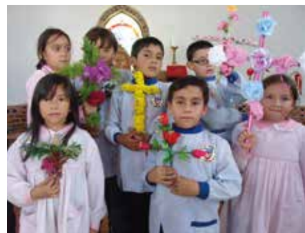
Les enfants présentent leurs croix de mai

belle France et la Colombie. Nous pouvons vous affirmer, pour l'avoir vu de nos yeux, tel le bon Saint Thomas, que là-bas, à 1600 m d'altitude, sur un bout de terre verdoyant, la sainte Messe est dite deux fois par jour : Notre Seigneur est là. Notre Seigneur est présent partout : dans la magnifique chapelle, dans l'école qui emploie 11 personnes pour 70 élèves (il y a sur cette terre chrétienne une urgence d'éducation), la maison des abbés qui accueille les volontaires, la ferme qui emploie 2 personnes, le verger avec ses dizaines d'essences, les 4000 plants de café. Tout cela est sorti de terre grâce à la volonté du Bon Dieu et de « ces hommes à part » qui révèlent, par une volonté hors du commun, bien plus qu'un projet d'éducateurs, de bâtisseurs, d'agriculteurs ; l'apostolat du prêtre, c'est la semence avant la récolte des âmes pour Le Royaume.