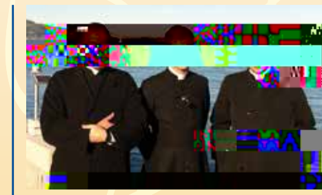
Devant la célèbre prison d'Alcatraz

Comme ce fut déjà le cas l'année dernière, un échange a eu lieu entre les diacres de nos deux séminaires. Nos quatre diacres francophones nous donnent un petit aperçu de leur voyage dans le « nouveau monde ».