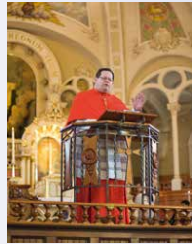
Prédication du Cardinal Lacroix à l'occasion d'une visite pastorale

L'église Saint-Zéphirin, affectée depuis 2010 à la Fraternité Saint-Pierre, rend hommage aux héros de la foi du XVII e siècle. Plusieurs toiles représentent l'arrivée de ces premiers missionnaires et l'annonce de l'Évangile auprès des nations indiennes. Les reliques des saints martyrs canadiens y sont également vénérées. La foi fut solidement implantée au Québec jusqu'à ce que la révolution tranquille vienne chambouler la Province dans les années soixante. Terre autrefois catholique, le Québec est aujourd'hui sous