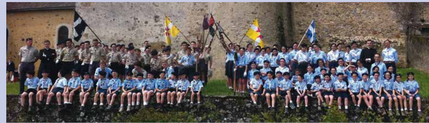
Le groupe Europa-scout du Mans au grand complet

Le temps faisant, les activités des prêtres de la Fraternité dans la ville du Mans se sont développées. Il faut mentionner en particulier les catéchismes, pour lesquels les salles du presbytère de la cathédrale du Mans sont généreusement mises à disposition par M. le Curé. L'ouverture de l'école primaire hors contrat Blanche-de-Castille, en septembre 2013, a accentué cette présence de la Fraternité en centre-ville. L'abbé Leclair y vient deux