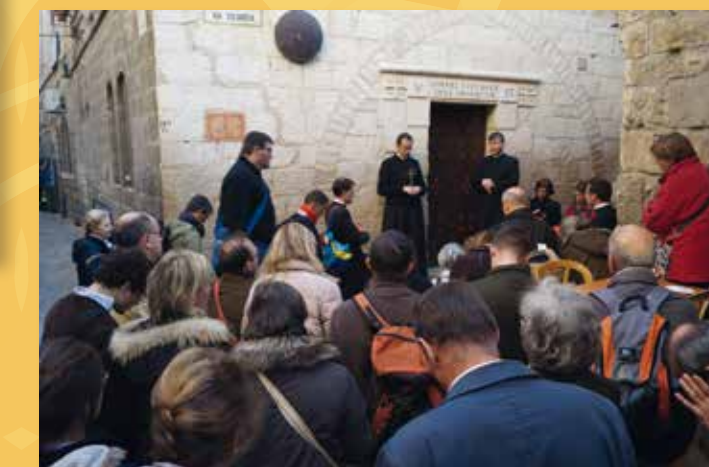
Chemin de croix à Jérusalem