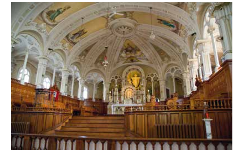
Le chœur de l'église Saint-Zéphirin-de-Stadacona

Lorsque j'ai vu pour la première fois le film La Loi du Silence d'Alfred Hitchcock dont l'action se déroule à Québec, je n'imaginai pas que la Providence me conduirait un jour à exercer un ministère sacerdotal dans l'église de l'abbé Logan, personnage principal de ce chef d'œuvre cinématographique. C'est pourtant bien à l'église Saint-Zéphirin-de-Stadacona, dans la capitale de la Belle Province, que j'arrivai il y a quelques mois, par une belle soirée d'été... car oui, il y a bien des étés au Québec!