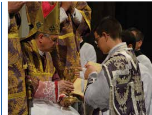
Le nouveau prêtre touche le calice et la patène

Portés par le chant du Te Deum , hymne d'action de grâce pour les bienfaits de Dieu, les trois nouveaux prêtres quittent le sanctuaire de Chartres, pleins de reconnaissance, mais également conscients de leur pauvreté et de leur misère face à la dignité de ce qu'ils ont reçu. « Car vous avez reçu