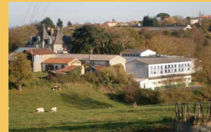
Un cadre propice à l'enseignement

L'école de l'Espérance, en Vendée, se veut être une école fondée sur la famille. Nos petits effectifs permettent aux cadres de bien connaître les garçons, leurs qualités et leurs défauts ainsi que leur environnement familial. Les élèves se sentent compris et aimés de leurs enseignants : élément propice à la confiance et au travail.