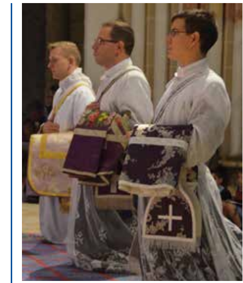
Les trois ordinands de la Fraternité Saint-Pierre

Samedi 28 juin 2014, en la vigile de la fête des saints apôtres Pierre et Paul, les voûtes majestueuses de la cathédrale gothique de Chartres résonnent des invocations suppliantes de la litanie des saints... Trois jeunes diacres sont prostrés, sur le sol du chœur. Dans moins d'une heure, ils seront prêtres pour l'éternité.