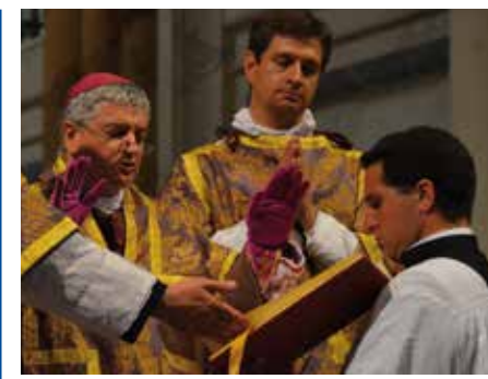
L'évêque récite la préface consécrationnaire

mènes, avant de les joindre avec un ruban noué, pour manifester que ces hommes sont désormais liés au Christ, « ordonnés au Christ ». L'évêque donne alors à toucher un calice, avec