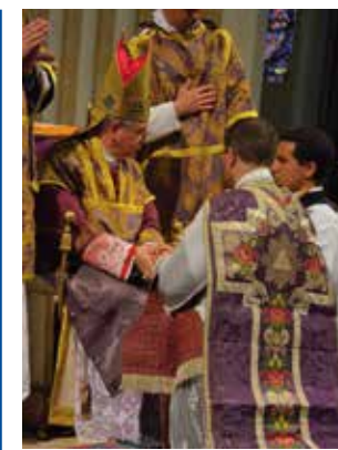
Le déploiement de la chasuble et la promesse d'obéissance à l'évêque