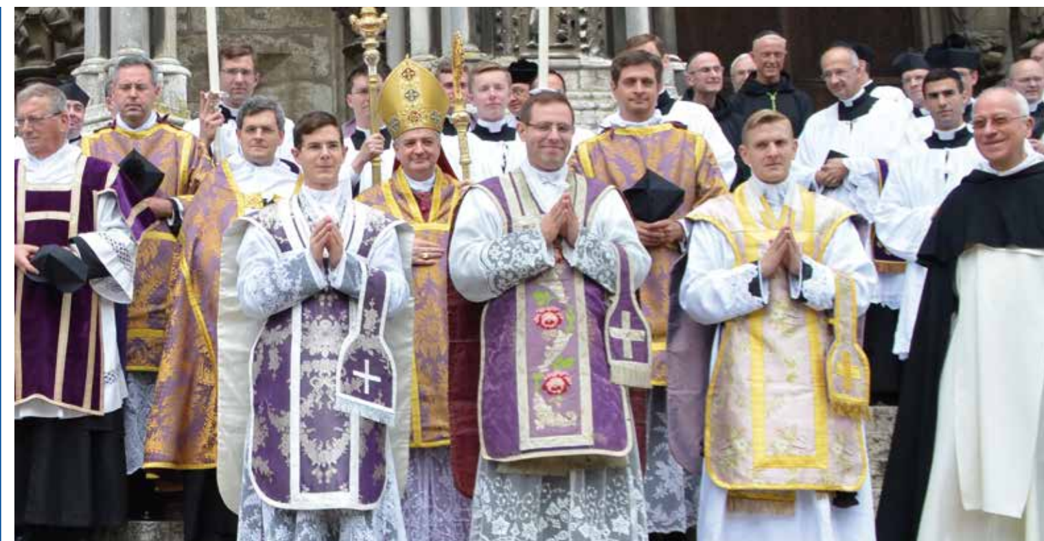
Trois nouveaux prêtres pour la FSSP

L'évêque peut alors reprendre le cours de la Messe, assisté, exceptionnellement, par les trois nouveaux prêtres qui récitent avec lui toutes les prières de l'offertoire et du canon.