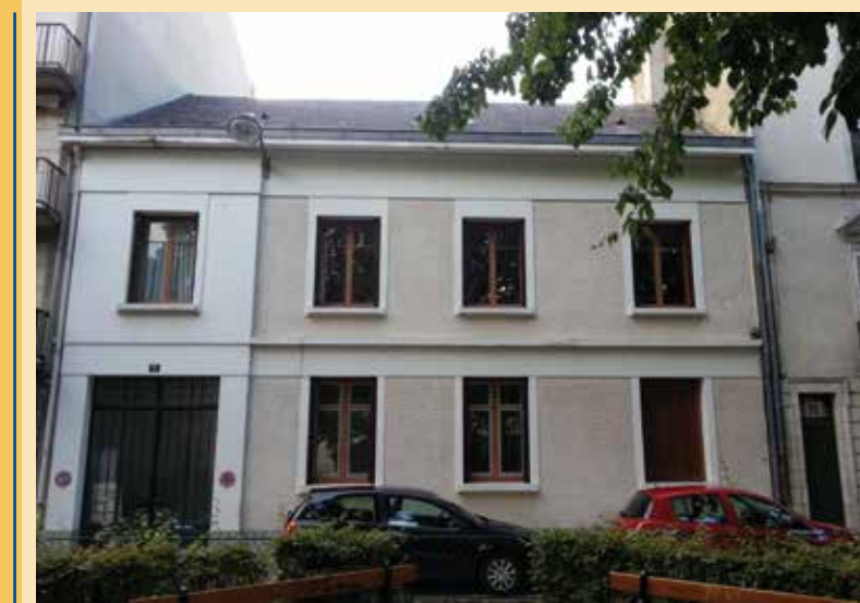
La façade de la nouvelle Maison de District