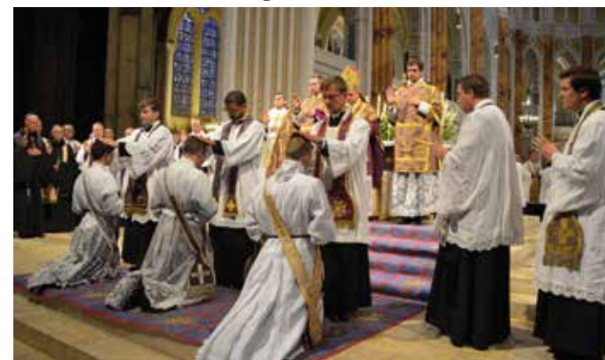
Les prêtres présents imposent les mains sur les ordinands

C'est ensuite le moment, pour Monseigneur Aillet, de transmettre aux jeunes prêtres la mission de célébrer la Messe. « Le prêtre est ordonné pour offrir... ». Cette tâche sublime est le cœur de sa vie sacerdotale, le sommet de ses journées, la source d'où découle toute son efficacité apostolique. Puis la cérémonie se poursuit, particulièrement éloquente : Monseigneur Aillet oint les mains des trois prêtres avec l'huile des catéchus-