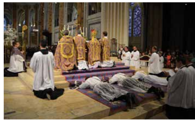
La prostration pendant le chant de la litanie des saints

Le standard demeure provisoirement le : 03 86 66 17 50.