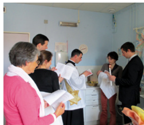
Baptême dans l'apostolat de Fontainebleau

Les besoins peuvent varier selon les villes où nous exerçons notre ministère ; aussi deux diacres n'auront pas forcément les mêmes activités. Pour ma part, il m'a été donné, en plus des sermons et des sacrements, d'intervenir dans une petite école en tant que professeur d'anglais, de chant et de sport. Le diacre, c'est le serviteur ! Parallèlement à cela, avec des jeunes de la communauté, nous avons prêté main-forte aux associations caritatives du secteur en participant aux banques alimentaires, petits déjeuners pour les pauvres et autres actions en faveur du prochain. Et puisque les grands eux aussi ont faim des choses de Dieu, mon supérieur m'a proposé de donner quelques cours de doctrine pour adultes, cours qui ont pris la forme d'une série de conférences sur les Dix Commandements. Enfin, il convient d'évoquer les grands débats de société au cours desquels, par notre présence, nous encourageons les veilleurs et manifestants à persévérer dans la lutte pour le bien.