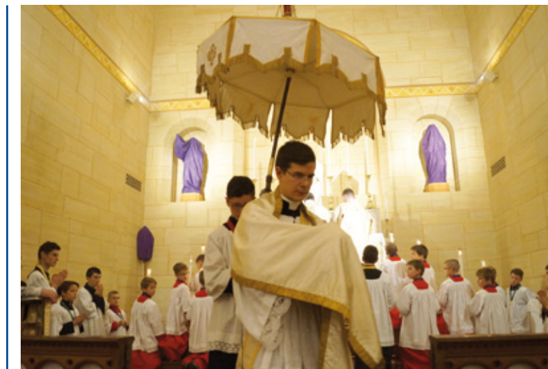
Procession avec le Saint-Sacrement à Versailles

Au soir du Jeudi saint, le Christ a célébré la première Messe de l'Histoire. En terminant par les paroles « Vous ferez cela en mémoire de moi », il transmettait son sacerdoce à ses apôtres. Mais auparavant, il leur avait lavé les pieds, leur enjoignant d'être les serviteurs les uns des autres.