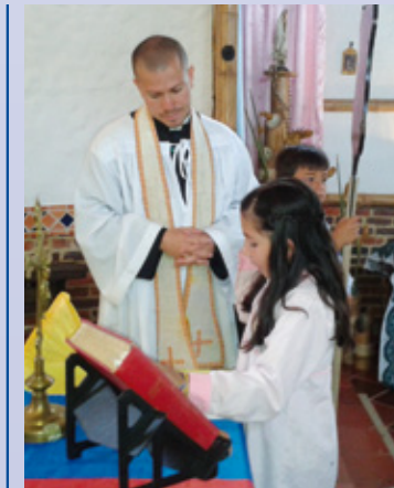
Election du représentant des élèves de l'école

Comme vous pouvez vous l'imaginer, la construction des nouvelles installations est d'une importance vitale pour la poursuite de ce projet éducatif lancé il y a maintenant 5 ans, le 3 février 2009.