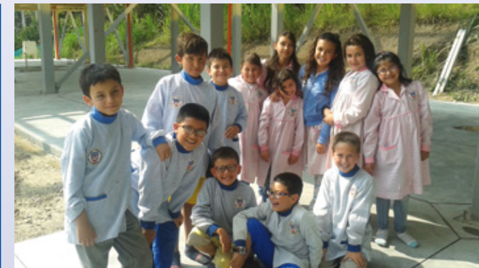
Des enfants heureux d'être à l'école

Il y a maintenant un peu plus de 5 ans, un projet éducatif avait été lancé dans notre mission en Colombie. Dans ce pays abîmé par 50 ans de conflit armé, cela devenait une priorité. Une école fut donc créée, avec comme idée maîtresse, la formation et l'éducation, selon la devise des Salésiens, d'une nouvelle génération de « bons chrétiens et d'honorables citoyens ».