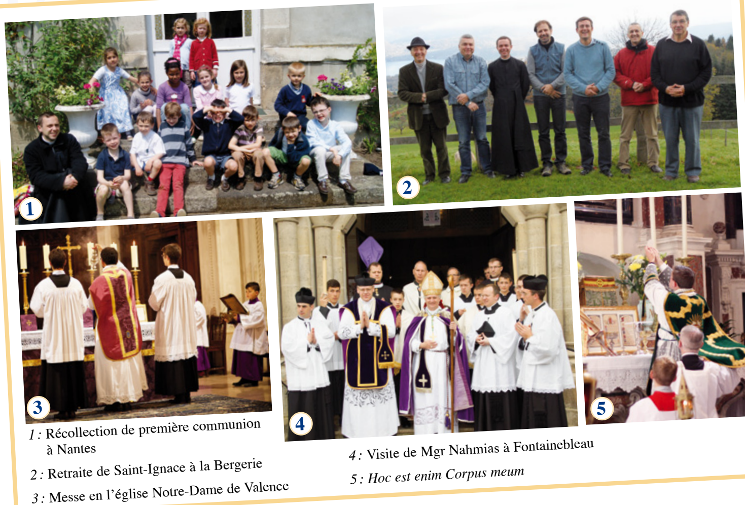
1: Récollection de première communion à Nantes 2: Retraite de Saint-Ignace à la Bergerie 3: Messe en l'église Notre-Dame de Valence