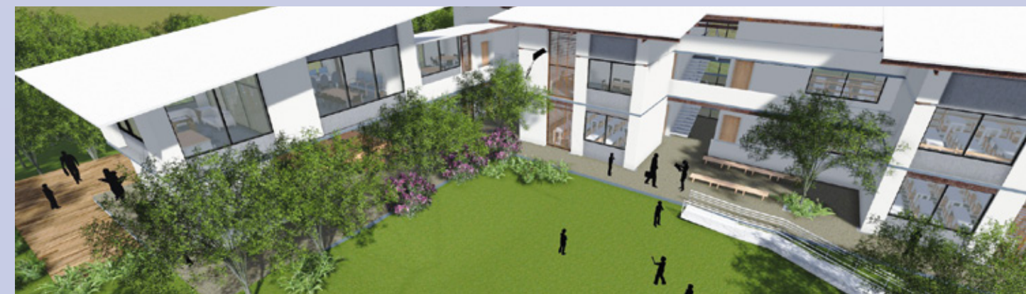
Le projet finalisé du Centre d'études Saint-Martin-de-Porres

Après un an de réflexion, la construction du Centre d'études Saint-Martin-de-Porres a été lancée ; on donna les premiers coups de pics et de pelles au mois d'avril 2013, creusant ainsi les fondations de ce qui sera, en résumé, un bâtiment de 1420 m 2 , habité par nos enfants et nos jeunes.