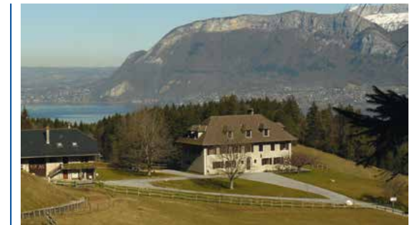
Un cadre propice au recueillement

Le printemps bat son plein ! Chacun d'entre nous va faire le grand ménage avant que n'arrive l'été... Mais si nos maisons ont besoin régulièrement d'un grand nettoyage, nos âmes n'en ont-elles pas besoin tout autant ? C'est pour vous aider à cela, chers amis, que la Fraternité Saint-Pierre a créé « l'Œuvre des Retraites » qui propose dans plusieurs régions de France diverses formules adaptées à chacun :