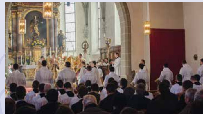
Les candidats aux ordres s'avancent devant l'évêque