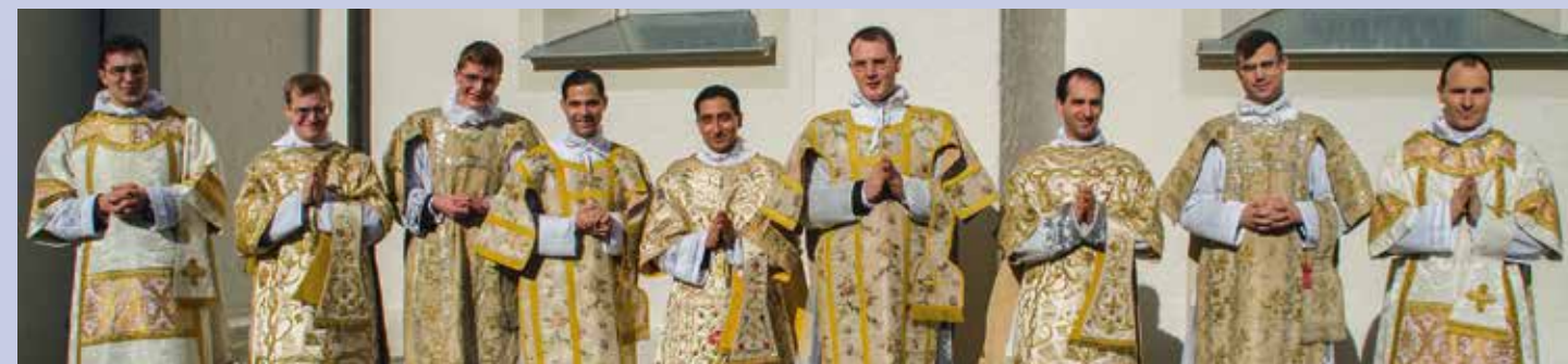
Neuf nouveaux sous-diacres pour l'Église

La cinquième année de séminaire est une année « creuse » : pas d'ordination prévue. Mais c'est une année, o combien riche, puisqu'elle est l'occasion pour les futurs prêtres de méditer sur les grâces qu'ils ont reçues jusqu'à ce jour et sur ce à quoi ils se préparent, en voyant dès aujourd'hui neuf séminaristes de sixième année recevoir le sous-diaconat. C'est le premier des ordres majeurs ; lui succéderont le diaconat, puis le