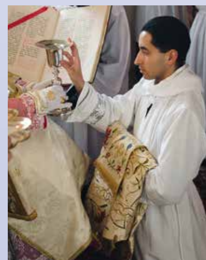
Le sous-diacre touche le calice et la patène

Après ce pas décisif, tous les neufs se sont prosternés devant l'autel en signe d'abandon confiant à la miséricorde de Dieu pendant qu'étaient chantées les litanies des saints, afin de solliciter les suffrages de la milice céleste. Puis, s'agenouillant tour à tour devant l'évêque, ils ont touché le calice et la patène, moment formel de leur