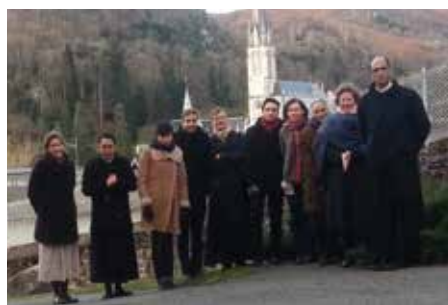
Retraite de saint Ignace à Lourdes

du lac d'Annecy en contrebas aide à acquérir la paix intérieure, but de toute retraite. Les montagnes elles, dont les sommets rejoignent les nuages, enseignent au retraitant qu'il est fait pour le Ciel et qu'il lui faut constamment élever ses désirs vers Dieu, pour qui il est créé, comme le lui enseigne le Principe et Fondement de saint Ignace. Ainsi, toute la nature qui entoure la Bergerie aide le retraitant à assimiler les enseignements reçus. Durant les temps libres, il pourra s'asseoir sur l'herbe pour méditer en silence face au paysage splendide, comme il pourra escalader les pentes du Semnoz en suivant le sentier muletier. La tombe même du fondateur