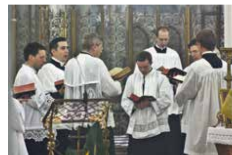
Chant de la messe à la basilique de l'Immaculée Conception