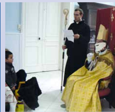
Visite du grand saint Nicolas

Le 6 décembre dernier, le grand saint Nicolas est venu nous visiter, accompagné du Père Fouettard. Éléves méritants (et professeurs) ont reçu quelques douceurs ! Et puis il y a eu le Noël de l'École, avec sa grand-messe chantée, son marché de Noël, son spectacle alternant Christmas Carols et autres Vilancicos , poèmes et saynètes pour évoquer le mystère de Noël, ... avant le récital de la chorale !