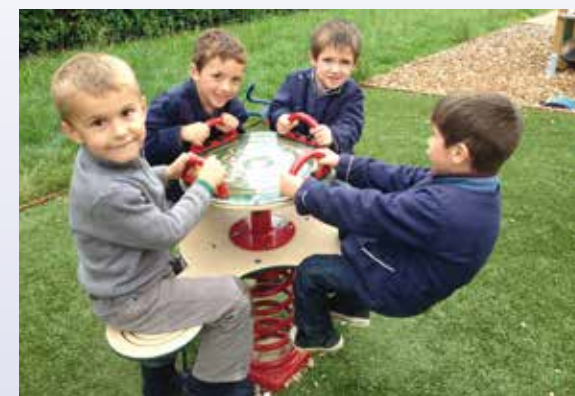
Les enfants profitent de la nouvelle cour de récréation

En ce début d'année, les élèves du collège ont pu bénéficier d'une formation adaptée sur l'anthropologie chrétienne, l'amitié, les relations entre garçons et filles.