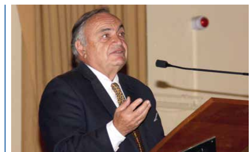
Un conférencier passionné et passionnant

« Qu'on vienne ici en procession » avait demandé Notre-Dame à Bernadette Soubirous.