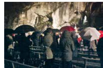
Procession des pèlerins à la Grotte