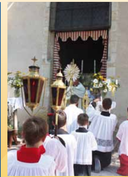
Bénédition à l'autel du reposoir

mystiques parmi lesquelles celle d'une lune échangée, c'est-à-dire rayonnante de lumière, mais incomplète, une bande noire la divisant en deux parties égales. Elle y vit la révélation qu'il manquait dans l'Église une fête solennelle en l'honneur du Très Saint-Sacrement. La Fête-Dieu s'accompagne d'une procession solennelle au cours de laquelle le prêtre porte l'Eucharistie dans un ostensor. Le Saint-Sacrement est abrité sous un dais et on marche habituellement sur un tapis de pétales de roses que des enfants jettent sur le chemin. La procession est entrecoupée de stations à des autels ornés, appelés reposoirs, disposés le long du parcours. ■