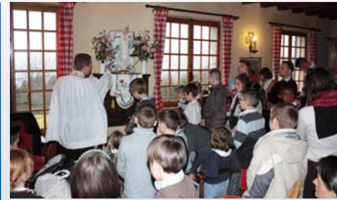
La statue de Notre-Dame installée dans son lieu définitif

Le lendemain, le Père célébra la messe dominicale à Duingt, en rite dominicain bien sûr ! Un peu dérouter au début, les fidèles surent vite s'y retrouver grâce aux livrets. La fin de la messe leur apporta une autre surprise de taille lorsqu'ils virent leur pasteur quitter la tribune pour s'avancer à travers la nef jusqu'au pied de l'autel où le prédicateur lui remit solennellement le scapulaire du Mont-Carmel ! Huit jours plus tard, pour le grand jour, une belle statue de Notre-Dame de Fatima ornée de fleurs attirait tous les regards des fidèles. Durant l'homélie, leur pasteur leur rappela le message essentiel de Fatima : l'appel à la conversion par la récitation quotidienne du chapelet et la consécration au Cœur