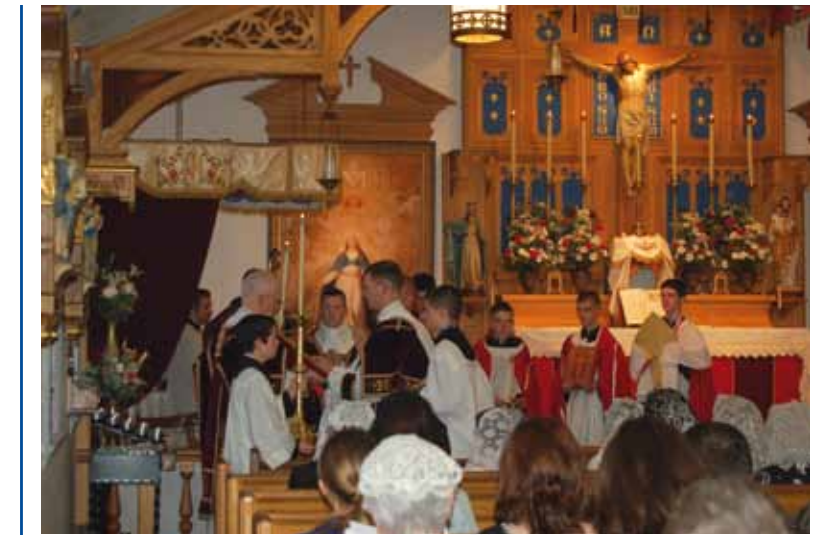
Messe pontificale dans notre paroisse

La Fraternité Saint-Pierre est internationale aussi bien dans son origine, son recrutement que son apostolat. Aujourd'hui, ses prêtres et séminaristes viennent des cinq continents où peu à peu ses apostolats s'y propagent. Ainsi, et peut-être malgré elle, la Fraternité renoue avec une pratique moyenâgeuse qui voyait ses clercs s'expatrier pour poursuivre leurs études et se mettre au service du Seigneur. Dans cette lignée, quelques prêtres français exercent leur ministère en des terres lointaines, en particulier sur le vaste continent américain. Dès le début des années 90, la FSSP a étendu son apostolat aux USA. Ainsi, par exemple, en 1993, à la mort d'un prêtre franciscain fort zélé, la FSSP s'est vue confier par l'évêque de Paterson la charge pastorale d'une communauté traditionnelle un peu hors norme située à Pequannock, dans le New Jersey. Un peu partout aux USA, de petites communautés de catholiques soucieux de conserver la foi catholique et la liturgie traditionnelle émergent à la suite des bouleversements d'après Concile. Celles-ci, appelées « chapelles indépendantes » en raison de leur légalité canonique souvent douteuse, persistent