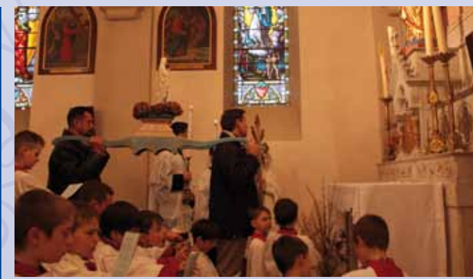
Prière devant l'autel de Marie