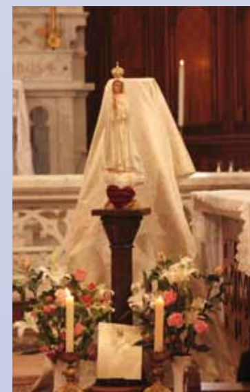
Le cœur en velours rouge contenant la liste de toutes les familles consacrées à Marie

Immaculé de Marie. À la fin de la messe, la procession avec en tête Notre-Dame de Lourdes emmena dehors clergé et fidèles au chant de l'Ave Maria... de Fatima ! Rentrés dans l'église, tous lurent ensemble l'acte de consécration qui fut inséré dans un cœur de velours rouge avec au dos la liste des familles consacrées. La procession redémarra ensuite, ponctuée par quelques haltes : devant l'autel de la Sainte Famille, devant la statue de Saint François de Sales, de Sainte Thérèse de Lisieux, à l'autel de Marie et pour terminer devant Saint Joseph ; ce fut l'occasion de prier pour les vocations, mais aussi de confier à Marie, par l'intercession de ces saints, les familles de notre communauté et toutes nos activités. Pour clôturer la journée, les fidèles étaient invités à partager leur repas à la Bergerie : malgré la pluie, la bonne humeur était présente, non moins que la piété, puisque la journée se termina par la récitation du chapelet et la bénédiction de la statue de consécration.