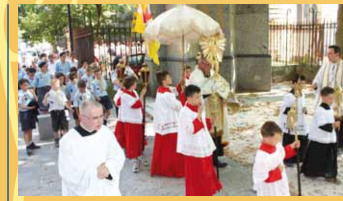
Procession du Saint-Sacrement

Chaque année, le jeudi qui suit la fête de la Sainte-Trinité (en France, la solennité est repoussée au dimanche suivant), une fête en l'honneur du Saint-Sacrement est célébrée : la Fête-Dieu également appelée Corpus Christi . Cette fête, qui commémore la présence réelle de Jésus-Christ dans le sacrement de l'Eucharistie, a été instituée par l'Église dès le XIII e siècle. C'est en grande partie à sainte Julienne qu'on la doit. À partir de 1209, elle eut de fréquentes visions